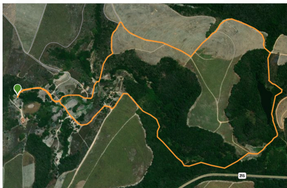
Imagem 1. Percurso da trilha.

*A programação está sujeita à alterações de acordo com o entendimento da organização.